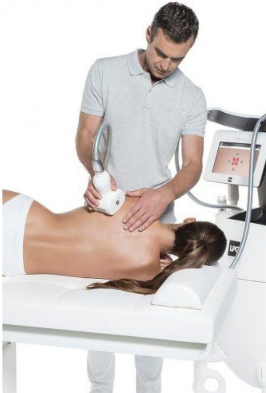
Traitement de mobilité de l'épaule avec endermologie médicale LPG®

travaillons également sur leur posture, le gain en élasticité et souplesse articulaire en particulier au niveau de l'épaule de manière à regagner une parfaite autonomie du coté opéré.