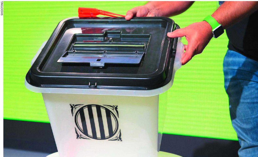
ASÍ SON LAS URNAS: UN «TUPPER» CHINO DE PLÁSTICO NO TRANSPARENTE. Los contenedores se venden en la página web de la empresa por entre 4 y 6 euros. Este modelo, con una capacidad de 45 litros y tapa negra, se ha utilizado en las elecciones de Uganda. En el 9-N las urnas fueron de cartón.

La Generalitat había preparado un entramado informático para que se votara online, como LA RAZÓN desveló el lunes P.14