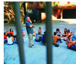
Asociaciones de padres ocuparon ayer los centros con sus hijos