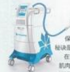
DANCE 双认证的 冷冻溶脂仪器 CooSculpting

将脂肪细胞“冻死”!听了之后是不是禁不住瑟瑟发抖?其实精准的冻凝清脂疗程的安全性得到国际FDA、CE双认证。不要以为自己敷冰块也可以,如何在操作过程中保证精准地将脂肪细胞冻死,而不伤害到其他皮肤组织才是关键。秘诀是,美容师在放置冷探头之前,会将特制的冷冻凝胶平铺在皮肤上,在治疗过程中隔离皮肤,确保“冻死”的是脂肪细胞,而皮肤、神经、肌肉等组织都不会被冻伤,整个过程虽然无痛,但的确是“冻感”十足,还好结束疗程后有养生热茶可以暖暖身体,一次疗程后微肿略有收紧,但体重毫无变化,更建议作为减肥的辅助手段。