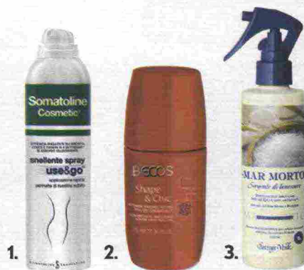
1. 2. 3.

AL MARE, DOPO LA DOCCIA, DAI LA PRIORITÀ AL DOPOSOLE. GIUSTO, MA PRIMA DI ANDARE A LETTO USA UN TRATTAMENTO URTO SPECIFICO.